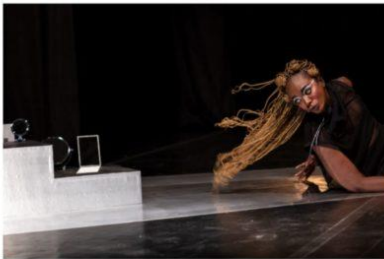
PANEL: INSTITUTION ALS ALLY

10. Februar 2022 18:30 / 19:30 Event Details